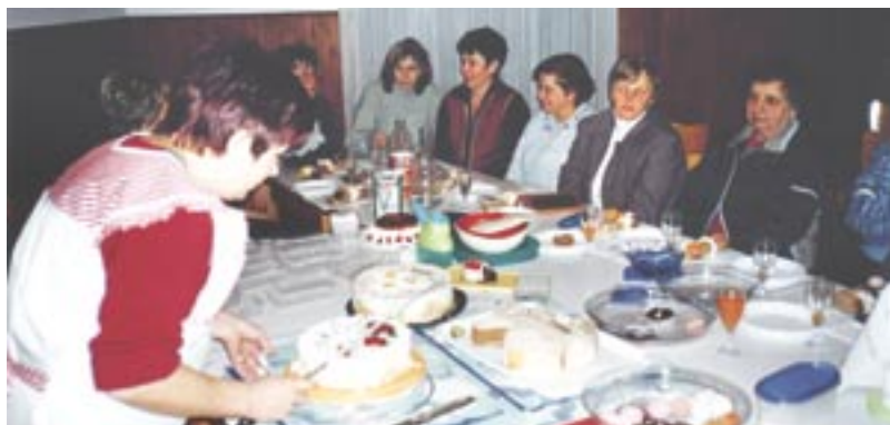
Vredno je bilo poskusiti.

Poleg humanega poslanstva, ki ga ima vsako prostovoljno gasilsko društvo, pa ima naše društvo tudi poslanstvo, da združuje vaščane, saj ob vsakoletnem občem zboru dvorana v domu kar »poka po šivih«. Obči zbor namreč ni le poročilo o delu preteklega leta, ampak je postal že kar nekakšen vaški praznik. Iz poročila je mogoče razbrati, da so gasilci veliko denarja porabili za nakup potrebne zaščitne opreme, delovnih oblek za žensko desetino in nakup dobro ohranjenega kombija. Tri desetine so se udeležile tudi tekmovanja Gasilske zveze Goriške, od tega sta se dve uvrstili na regijsko tekmovanje, pionirji pa so dosegli še več – maja bodo zastopali barve domačega gasilskega društva na državnem tekmovanju v Kočevju.