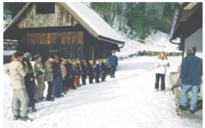
Zimovanje v vasi Soča.

Taborniška opravila so nas spremljala do trenutka, ko smo se zapodili v sneg. Toliko snega že dolgo nismo videli. Navdušanje je bilo nepopisno, tako da smo takoj pričeli ustvarjati snežne skulpture. Izdelali smo iglu, grad, polno želv, ki so krasile pot do koč. Tudi na sneženega moža nismo pozabili.