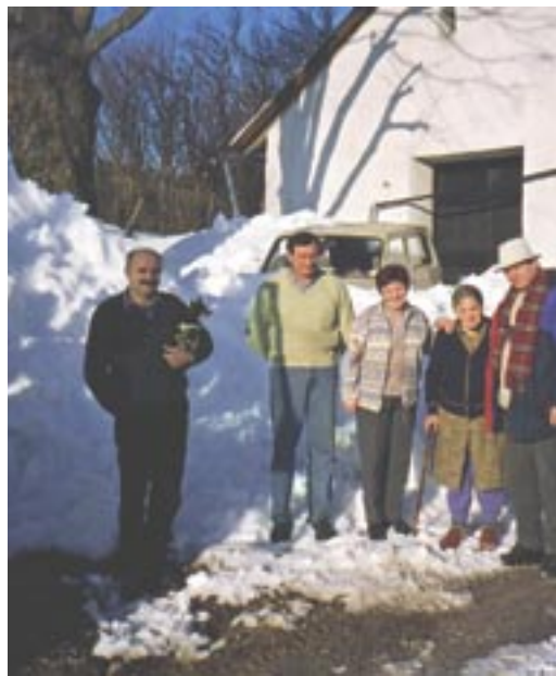
Vaščani Lipc ne pomnijo, kdaj je na zadnje zapadlo toliko snega

stalnega prebivalstva (RSP) in izdaja potrdila iz tega registra, sprejema prijave in odjave začasnega prebivališča, vodi evidenco volilne pravice, ažurira volilne imenike in potrjuje podpore volivcev. Vodi tudi evidenco gospodinjstev in izdaja potrdila iz te evidence, kar vas bo stalo 170 tolarjev, če ni določeno drugače.