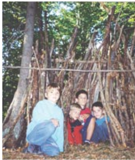
Za spomin še ena 'gasilska' slika.

V zavetišče iz lesa so se zatekli nekateri moji sošolci.