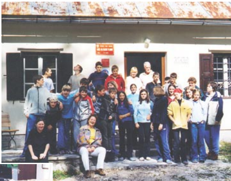
Kočja na planini Razor je bila pet dni naš drugi dom.

Ob koncu projekta smo dobili odgovor na vprašanje, ki smo si ga med projektom večkrat postavili: »Ali škrat res živi?« Ponudili so ga otroci sami: »Škrat lahko je prav vsak, le živali in rastline mora imeti rad.«