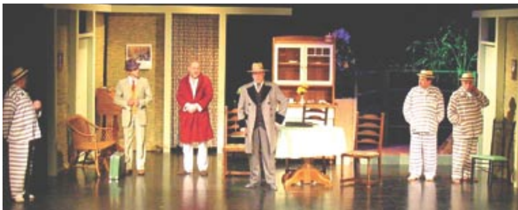
Naši trije angeli na odrskih deskah Kulturnega doma v Desklah.

Skorajda dve uri prijetnega hahljanja in hurovskega smeha med premiernim občinstvom