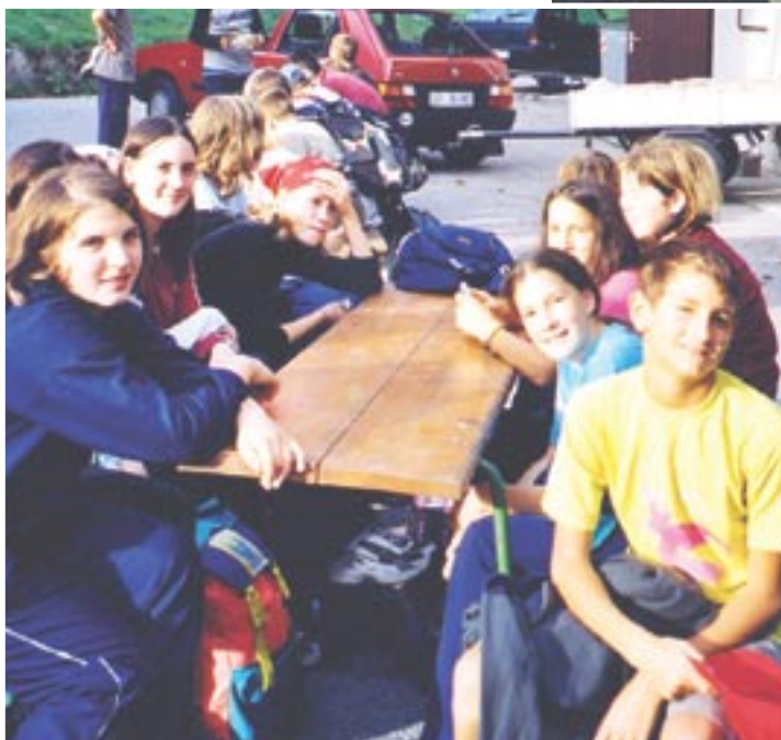
Počitek pred kočjo.

Med taborom smo se povzpeli na Vogel, na prelaz Globoko, vreme pa nam ni dovolilo, da bi osvojili vrh tolminskega Migovca. Na pohode smo vzeli s sabo čaj, malico pa so imele v nahrbtniku učiteljice. Hoja v družbi sošolcev je bila vedno prijetna. Ker je bilo ves teden nestanovitno vreme, smo imeli razgled le s prelaza Globoko. Na poti na Vogel smo opazili italijansko utrdbo in nekaj drugih ostankov takratnega obdobja. Zame planinski pohodi niso bili nič novega, za nekatere sošolce pa so to bila prva srečanja s sredogorjem. Ob poteh je raslo veliko drobnega gorskega cvetja,