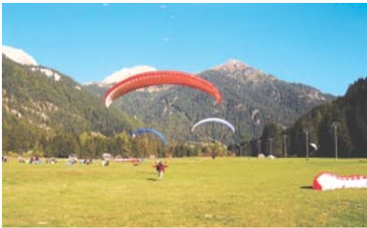
Leteti in pristati kot ptica.

In za konec še nekaj o starosti padalcev. Letnica na osebni izkaznici ni prav nobena ovira, saj poznam tako fante, ki imajo 15 let, kot tudi moškega, ki šteje že 76 let. Z aktivnim letenjem je namreč pričel pri šestdesetih.