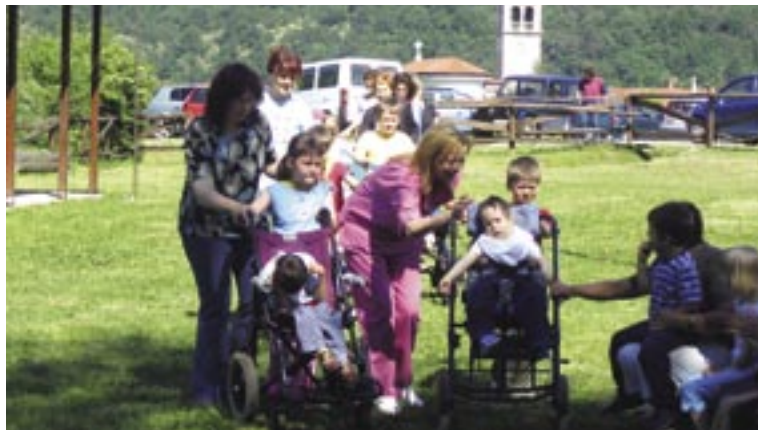
Otroci iz vrtca v Desklah so nestrpno pričakovali vrstnike iz Stare Gore.