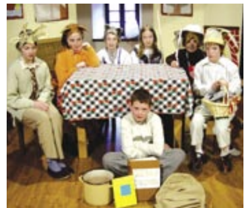
Mladi igralci na skupinski sliki.

Pri vajah smo se lepo zabavali. Imeli smo veliko vaj, tudi dvakrat tedensko. Premiero gledališke predstave smo pripravili v gotski hiši v Kanalu. Naš prvi nastop so si ogledali otroci iz vrta, sledil mu je nastop za starše in za 2., 3. in 4. razred. Z igro smo nastopili tudi v kulturnem domu v Desklah, za naše sošolce, njihova starše in druge krajane. Predstavo smo posneli tudi na videokaseto.