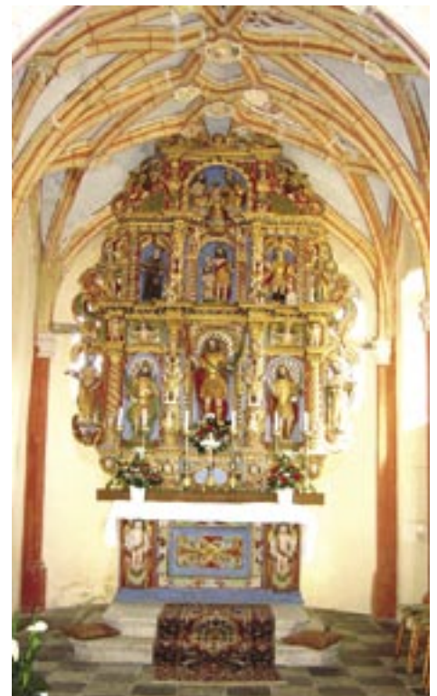
Veliki zlati oltar.

Ob 500-letnici cerkve so za izdajo obeh publikacij in za organizacijo vseh prireditev priskočili na pomoč sponzorji in donatorji, med njimi občina Kanal ob Soči, za pogostitev in pripravo prireditvenega prostora pa so se izredno potrudili župljani župnije Marijino Celje - Lig.