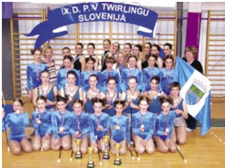
Desklanske mažorete so se s tekmovanja v Zrečah vrnila polne medalj.

Twirling skupina Deskle se udeležila devetega državnega prvenstva v twirlingu Slovenije. Tekmovanje je bilo 23. in 24. aprila v Zrečah. Dekleta so se tako kot vsako leto odlično odrezala in domov prinesla veliko medalj ter uvrstitev na evropsko prvenstvo in na tekmovalje za evropski pokal.