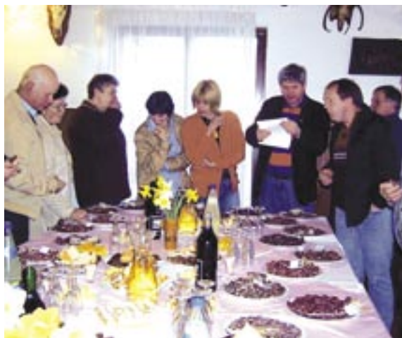
Po podelitvi nagrad so se odprla vrata sobe, kjer je bilo mogoče poskusiti vse 38 salam.

To so nam dokazali ponosni lastniki domačih salam prvo aprilsko soboto, ki so svoje »trofeje« prinesli na ocenjevanje suho mesnih izdelkov v gostilno v Levpi. Letos je ocenjevanje potekalo že tretjič. Ocenjevala je tri članska komisija iz kmetijsko gozdarskega zavoda Nova Gorica, ki je imela kar precej dela, saj je morala oceniti kar 38 salam. Salame so ocenjevali po zunanjem videzu, po notranjem videzu prereza ter po okusu.