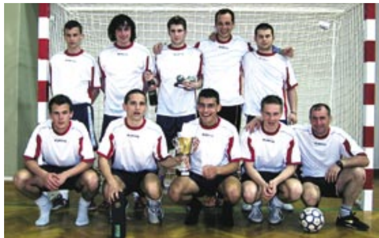
Zmagovalna ekipa prihaja iz Dornberka.

Malonogometni klub Sizif iz Ročinja je uspešno organiziral že šesti malonogometni turnir »Joma Cup« 2005, ki je bil konec aprila v športni dvorani v Kanalu in je popestril dogajanje med prvomajskimi prazniki.