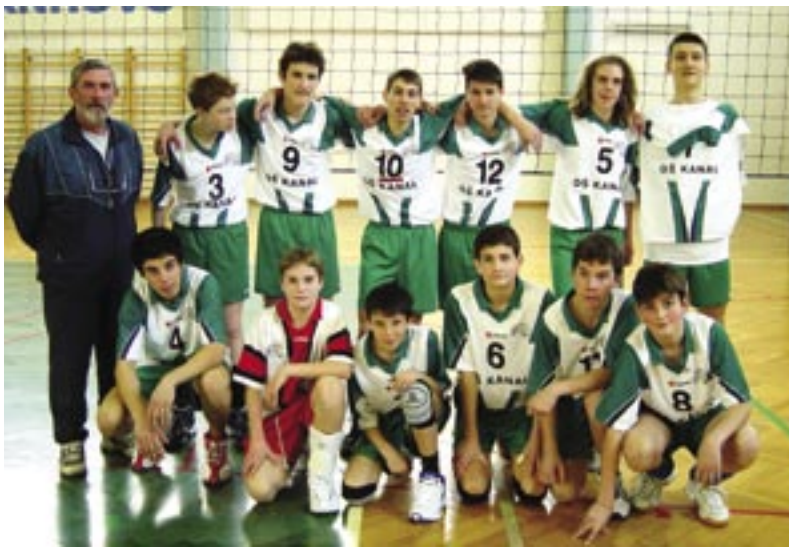
Mladi igralci na skupinski sliki.