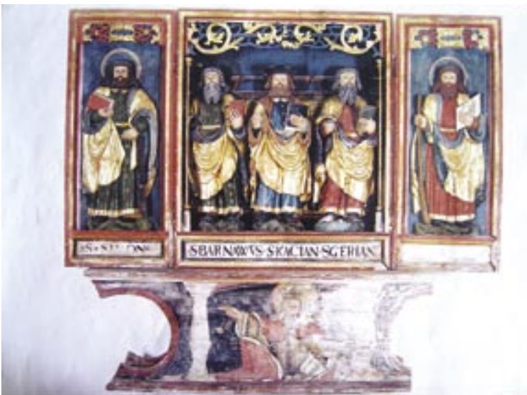
Gotski krilni oltar.

Cerkev v Britofu je vredna ogleda kadarkoli. Če je vas poznana po mejnem prehodu, po nekdanji obmejni karavli JLA, danes gostišču, je veliki večini ljudi neznano, da je cerkva na holmčku pravi kulturno umetniški biser. Že njena zunanost, ki je grajena v poznogotskem stilu, je ljubka in izredno lepa na pogled. Ko vstopimo skozi šilast in paličasto profiliran