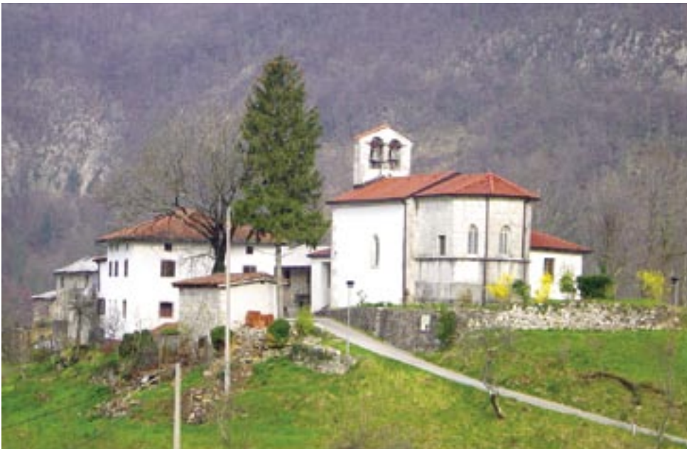
Cerkev svetega Kancijana v Britofu.

Cerkvico je župnija Marijino Celje temeljito obnovila leta 2001, za njeno vzdrževanje pa gre zahvala peščici ljudi, ki še živijo v vasici Britof. Vaščani vam ob obisku cerkev tudi prijazno odprejo in razkažejo.