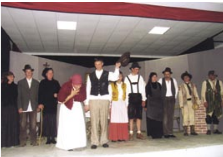
Polna dvorana je z navdušenjem pozdravila novo igro etnološke gledališke skupine Kontrabant čez Idrijo.

Predstava je bila odigrana izjemno doživeto in vsak posebej je očaral in dokazal, da je ljubiteljsko igranje dar, tako za igralca kot za publiko. Škoda bi bilo, če je na kambreško-liškem Kolovratu ne bi negovali. Igralci iz vseh treh krajevnih skupnosti Lig, Ročinj in Kambreško pa niso samo kulturni, ampak tudi turistični ambasadorji na svojih gostovanjih.