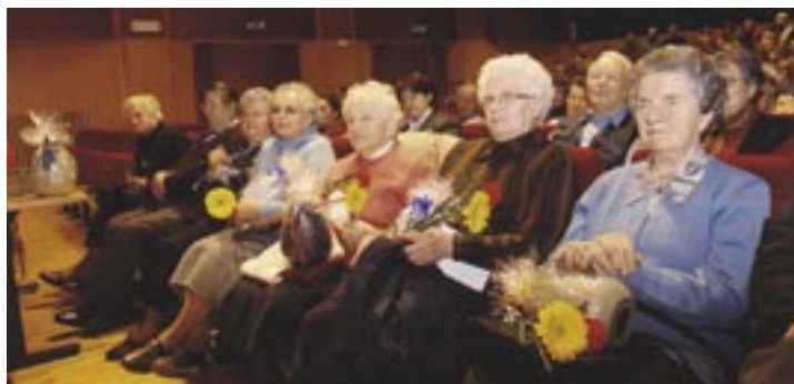
Na občnem zboru smo spominske nagrade podelili našim jubilarantom.