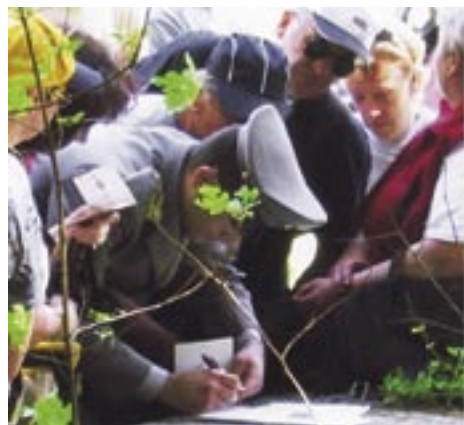
Evropa smo ljudje - ljudje gradimo Evropo.

T.R.D. Globočak - Kambreško je letos izpeljalo že tretji mednarodni pohod, med drugim lanskega prvomajskega Solarji - Podklanec - Britof. Kljub vsem potrebnim papirjem in obveznem plačilu (izredno odprtje mejnega prehoda Podklanec) pa meja še vedno preseneča in do polnopravnega članstva je še daleč - morda predaleč - kajti sosedske odnose je treba negovati, predvsem pa poznati.