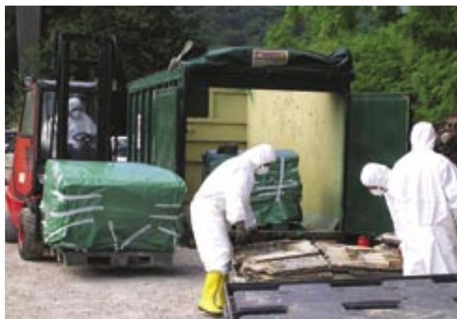
Delavci podjetja Robnik so v zaščitnih oblekah, obutvi in maskah pravilno zavarovali azbestnocementne kritine in jih zložili v ustrezne zabojnike.

Občina Kanal ob Soči je pred dobrimi štirinajstimi dnevi dala strokovno in varno odstraniti več kot 18 ton azbestnocementnih kritin, ki so jih ljudje nezakonito odložili na levi breg Soče tik pred novim mostom v podjetju Salonit Anhovo.