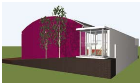
Tako je na računalniški simulaciji videti nova telovadnica v Desklah.

Funda upa, da bodo tako zgledno kot pri pripravi prostorskih ureditvenih pogojev za območje Salonita na levem bregu Soče, s kanalsko občino sodelovali tudi pri pripravi prostorskih pogojev za urejanje naselja Anhovo in kamnolomov na levem bregu Soče.