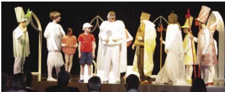
Nastopili smo v dvorani v Desklah.