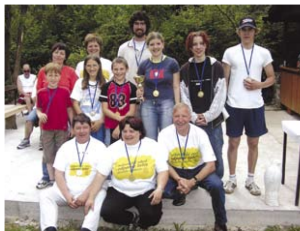
Vsi dobitniki medalj.

Seveda smo po naporni tekmi poskrbeli, da smo se vsi udeleženci okrepili z že tra-