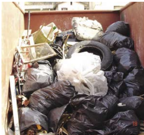
Rezultat letošnje čistilne akcije v Kanalu.

»Začeli smo s spomladansko čistilno akcijo, ki smo jo izvedli 18. marca. Z veseljem lahko rečem, da se je akcije poleg članov našega društva udeležilo kar nekaj članov ostalih društev. V veliko pomoč pri odvažanju smeti v pripravljene zabojnike pa so nam bili člani Prostovoljnega gasilskega društva Kanal. V veliki meri smo očistili bregove reke Soče od Ajbe do Morskega, skupina ljudi pa se je lotila tudi čiščenja kampa. Opazili smo, da ima ta akcija vidne rezultate, saj je z leti smeti vseeno nekoliko manj. Ljudje smo pač različni. Upamo, da se bo marsikdo ob pogledu na očiščeno strugo premislil in ne bo pustil smeti in odpadkov kar tam nekje sredi lepega soškega kamenja. Ker bomo čistilno akcijo imeli tudi v letu 2007, vas že sedaj prav lepo vabim, da se nam pridružite.«