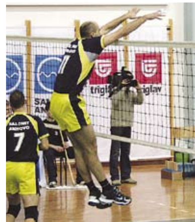
Berlot v bloku na pokalu Slovenije.

»V klubu imamo razdeljene naloge in področja. Kljub morebitni želji posameznika, ki želi dobro ekipo, v težkih trenutkih dajemo prednost stroki in strokovnemu delu navsezadnje vsak odgovarja za svoje področje za kar konec koncev tudi odgovarjajo.»