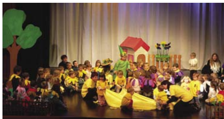
Staršem smo v dvorani v Desklah odigrali prirejeno vsebino knjižice Dogodivščine na čarobnem travniku.