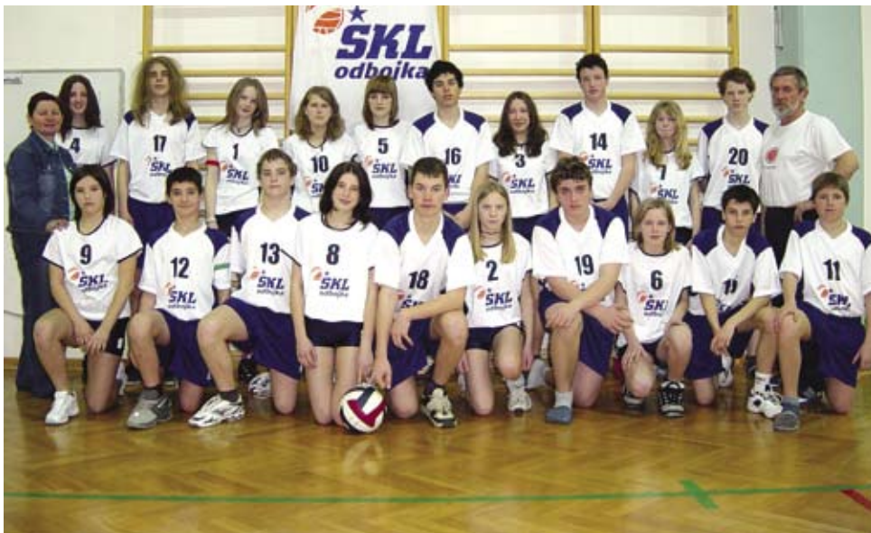
Odbojkerska ekipa osnovne šole v Kanalu.

Ob tej priložnosti se zahvaljujem vsem, ki so nam omogočili treninge, tako Salonitu Anhovo, OŠ Kanal kot tudi občini Kanal ob Soči in seveda tudi našim trenerjem, da krojimo sam vrh slovenske in morda čez nekaj let tudi mednarodne odbojke!