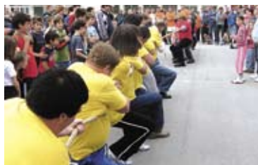
Vlečenje vrvi je bilo napeto,...

Na letošnjih športnih igrah krajevnih skupnosti nas bodo spominjale raznobarvne majice, ki jih bomo nosili tudi v toplih poletnih dneh. V oknu TIC-a v Kanalu si lahko ogledate nekaj utrinkov s tekmovanj.