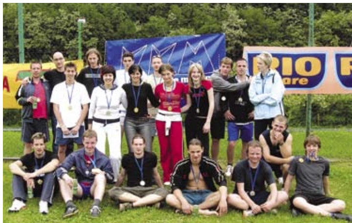
Zmagovalci na skupinski sliki.

Tokrat se je na željo lanskoletnih tekmovalk, ki so lani nastopile v skupini skupaj z moškimi, uvedlo posebno skupino za predstavnice