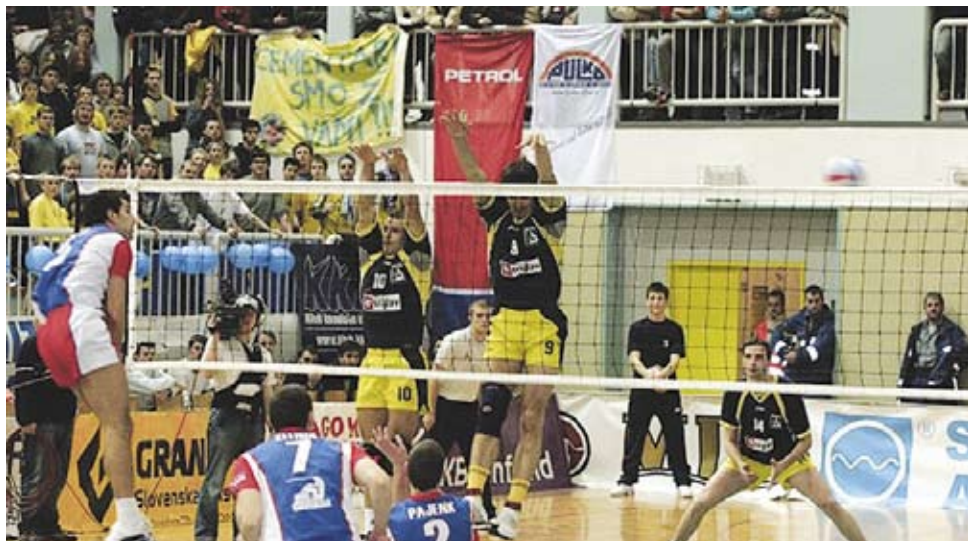
Igralci OK Salonit Anhovo v finalu pokala Slovenije.

»Na začetku sezone smo si zadali, da bomo tako v pokalnem kot tudi v prvenstvenem delu prišli vsaj med prve štiri ekipe, kar nam je tudi uspelo. V pokalu smo izločili prvega favorita in s tem presenetili vse ljubitelje odbojke in se tako uvrstili na zaključni turnir pokala