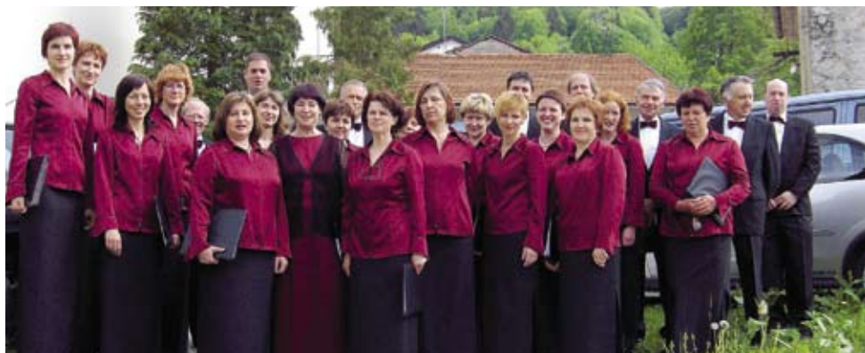
Članici mešanega pevskega zbora Jože Srebrnič.