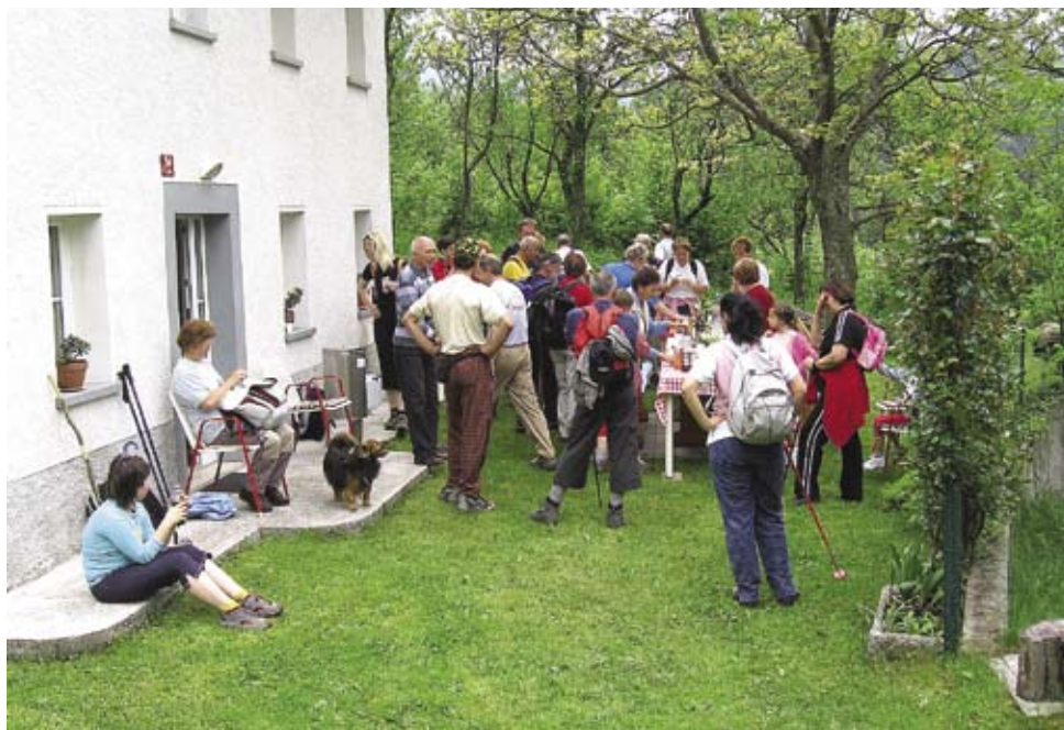
Organizatorji so poskrbeli, da so pohodniki sproti obnavljali porabljene kalorije.

Kljub številni udeležbi je naš pohod ohranil domačnost in je tako kot vedno doslej tudi letos navdušil. Naj vam prišepnem, da se bomo potrudili, da bo tudi v prihodnje tako.