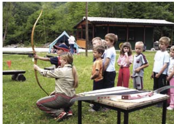
Vrtec Deskle je gostil vrtec iz Kanala v sodelovanju tabornikov ROZA.

Ker smo jutranje bujenje in ostalo že opravili pred prihodom na prostor, smo se razdelili v skupine. Pripravili smo jim šotore za domovanje, jih seznanili z lokostrelstvom, pozabavali so se z metanjem žoge v koš in nogometom. Otroci so bili najbolj navdušeni nad lokom in šotori. Po opravljenih preizkušnjah smo jim zakurili velik taborni ogenj. Okoli dvanajstih, so se nam iz zraka pridružili še padalci, katerih so bili otroci zelo veseli. Občudovali so njihov pristanek pospravljanje padal. Poslovali smo se z željo, da bi se še kdaj srečali.