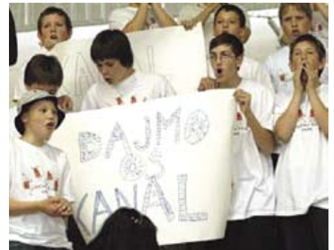
Navijači so odbojkarje burno spodbujali.

Letošnji dan odprtih vrat na OŠ Kanal je naravnost navdušil. Naša šola je gostila šolsko odbojkersko ligo (ŠOL) in se s tem predstavila ne le domačinom, pač pa je vrata na stežaj odprla celotni slovenski javnosti.