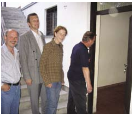
Večnamenska stavba v Kalu nad Kanalom je spet prešla v občinsko last.

Celotna večnamenska stavba, vključno s prostori trgovine in skladiščem, ki ga je leta 1979 zgradil Odbor za odpravo posledic potresa za potrebe trgovine, pošte, krajevnega urada in za potrebe krajevne skupnosti, je bil do leta 1988 družbena lastnina, v uporabi kra-