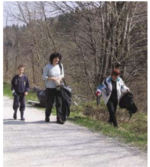
Za delo so poprijeli vsi.

Tudi letošnja čistilna akcija je uspela, želimo pa si, da bi se ekološka ozaveščenost ljudi izboljšala, saj mora biti čista narava skrb vseh nas. Sami moramo poskrbeti vsaj za tisti del okolja, na katerega lahko vplivamo. To pa je čim manj odvržene nesnage tja, kamor ne sodi.