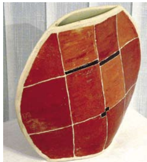
Delo Silve Gornjak.

To je čezmejna razstava in tudi ob tej priložnosti je ustvarjalnost vir spoznanja in soočanja umetnikov z dveh ozemelj, ki jo ločuje mejna nit. Razstava pa ni samo to. Umetniški trenutki so priložnosti za srečanja. Skupaj želimo ovrednotiti keramiko, da bi ponovno dosegla antični sijaj, o katerem pričajo številne najdbe, ki so jih odkrili na našem ozemlju. Izmenjava med različnimi