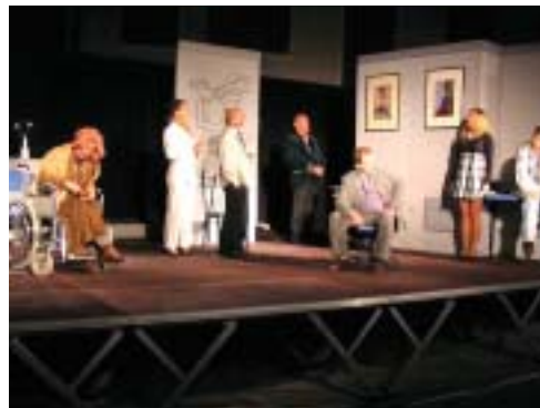
Na Kontradi so igrali kljub rahlemu rosenju.

Kanalu. V prijetnem, malo mrzlem večeru si je prestavo ogledalo okrog sto obiskovalcev, ki so z burnim s svojim aplavzom nagradili trud celotnega ansambla. Nato so predstavo ponovili na placu v Ročinju in naslednji dan še v