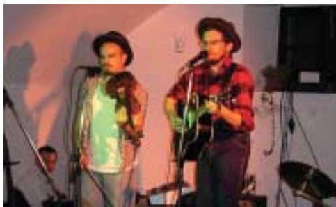
Slon in sadež

Morda se še spomnite KaKaM-a, ki je živel v kanalski dvorani in sanjal o novih prostorih pod športno dvorano? Žal, se sanje niso uresničile, kar je ob ostalih težavah pripomoglo h koncu mladinske kulture. Lanskega novembra pa smo se končno odločili, da ustanovimo Klub kanalske mladine (KKM) in s tem naredimo konec besedam, da se v Kanalu nič ne dogaja.