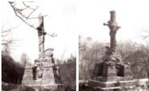
Spomenik na nekdanjem italijanskem pokopališču iz 1. sv. vojne.

Skupina zgodovinskih spomenikov je silno raznolika zmes preostankov iz preteklosti. Velikokrat so ti spomeniki na zunaj manj opazni, saj njihove spomeniške lastnosti določajo zgodovinska pričevalnost in zgodovinska dogajanja, ne pa samo njihove