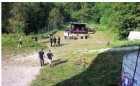
Piknik A u O.

Poleg tega smo si obetali že obljubljene prostore pod športno dvorano, kjer naj bi nastal mladinski kulturni center. S tako zelenimi prostori, ki nam jih je dala v najem občina Kanal ob Soči, in denarjem iz občinskega proračuna, začelo novo obdobje kanalske mladine. Poleg denarja iz občinskega proračuna, denar prispevajo tudi sponzorji,