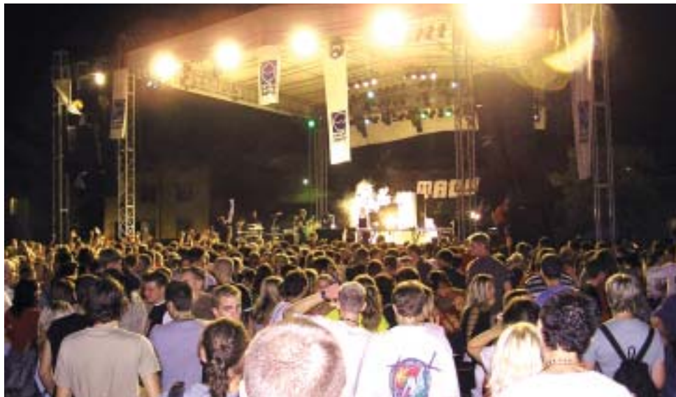
Nočna izmena.

S financiranjem in sponzorji je večni problem. Prvi dve leti smo imeli na leto približno 150 tisoč tolarjev. V veliko pomoč nam je bil Salonit Anhovo, ker nam je omogočil prodajo pijače leta 2001 in letos, mi smo njihovo ponudbo z veseljem sprejeli in z udarniškim delom mladinskemu klubu prisluzili nekaj denarja. V tem obdobju smo organizirali 23 prireditev, ki smo jih uspešno izpeljali. Veliko je bilo koncertov, prvo leto je nastopilo veliko manjših glasbenih skupin, na primer Bulba Sao, Authentics (Trst), The Drinkers, Eclipse, turnir v namiznem tenisu, potopisi. Lani pa smo organizirali koncerte znanih skupin Miladojke Youneed, Ana Pupedan, Demolition Group, O.S.T., Kud Idiots in drugih, nato pa je nastopila huda finančna kriza. Z delom smo ponovno začeli letos,