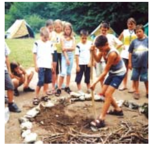
Pripravljanje tabornega ognja.

Taborniki Roža imamo pester program, zato upamo, da nam bodo učenci prisluhnili in se nam pridružili, ker le tako bomo močnejši in številčnejši. Potrebujemo nove ideje in spoznanja, skupaj jih bomo uresničili. Taborniki Z D R A V O.