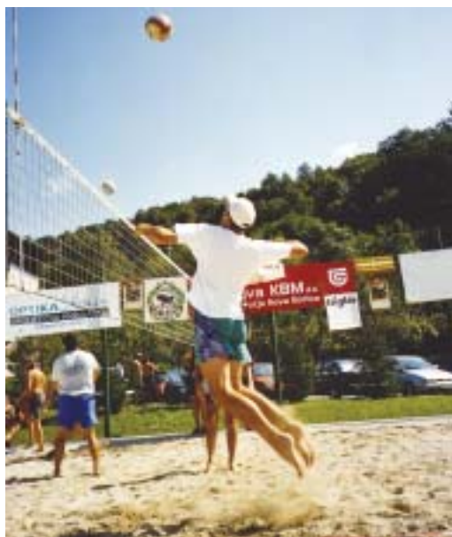
Utrinek z odbojke na mivki v Morskem.

V občini je kar nekaj športnih društev in objektov, v katerih potekajo bolj ali manj redno športne aktivnosti, v načrtih pa sta še dva športna parka, ki bosta dodatno popestrila ponudbo.