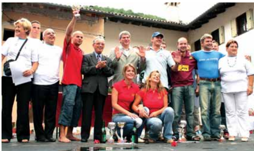
Zmagovalci z organizatorji tradicionalnih skokov.

Prireditev je lepo uspela. Kljub slabemu vremenu v celi Slovenije smo imeli na skokih okoli 1500 gledalcev.