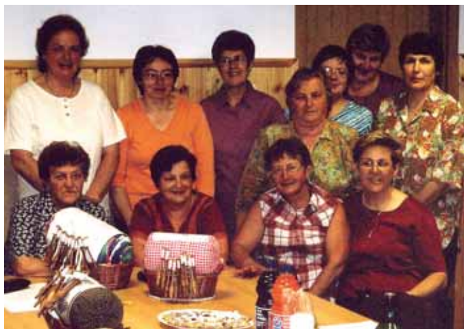
Pridne roke so klekljale od jeseni do pomladi.