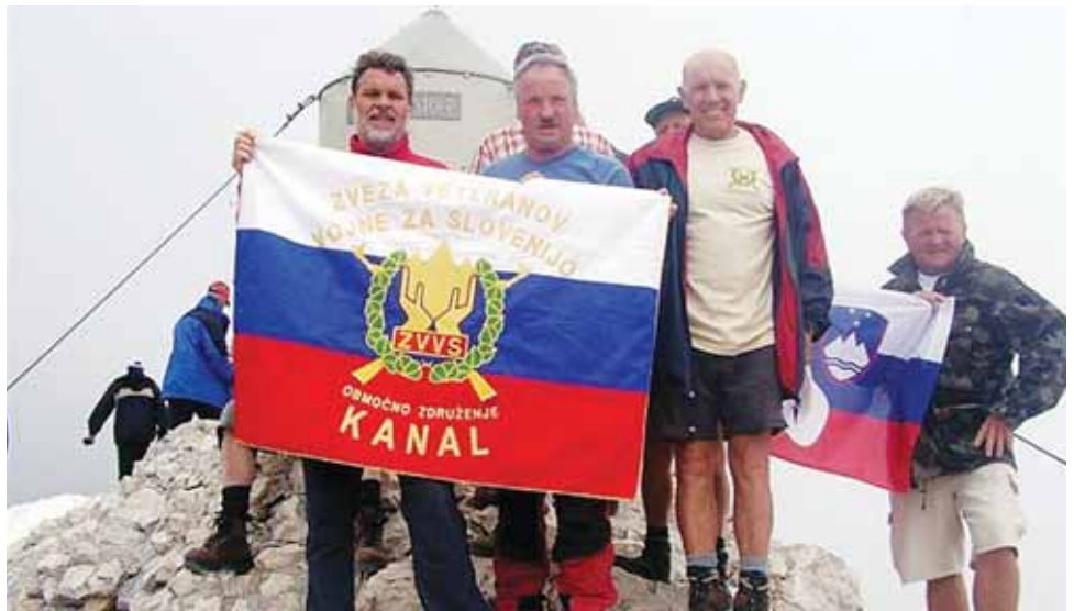
Na vrhu Triglava je letos plapolal tudi naš prapor.

Druga - najštevilčnejša skupina, ki je opravljala organizacijske posle, je krenila po »uradni« potji pohoda in sicer z Rudnega polja mimo Vodnikovega doma in Kredarice na vrh. Del naše odprave pa je izbral pot iz