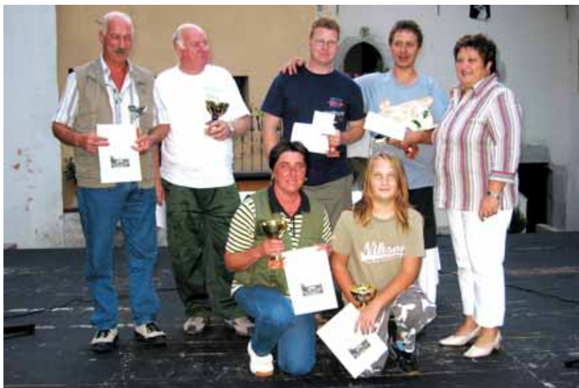
Nagrajenci letošnjega lova na klena.

Tako se je lov na klena za leto 2006 končal. Sledila je še zabava s plesom. Žal pa se je nam na Kontradi pridružilo zelo malo sokrajanov. Upamo, da bo v naslednjem letu za našo prireditev več zanimanja tako med ribiči kot med ostalimi krajanji. Mogoče pa bomo povabili tudi ribiče iz drugih koncev Slovenije ali pa zamejstva.