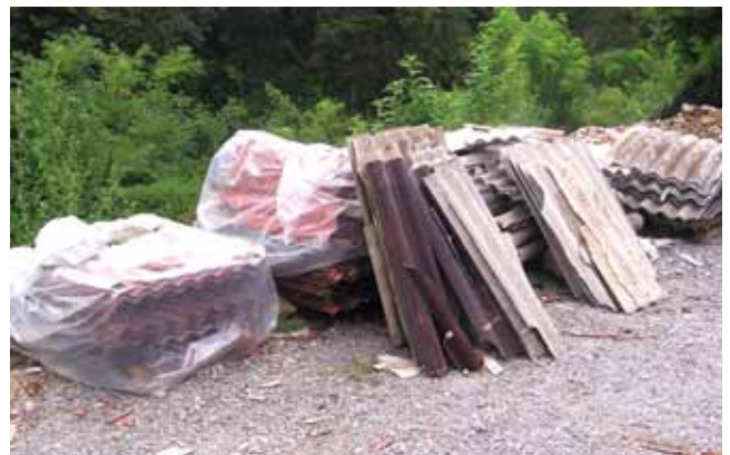
Azbest-cementne kritine pravilno in napačno odložene, predvsem pa ob nepravem času.