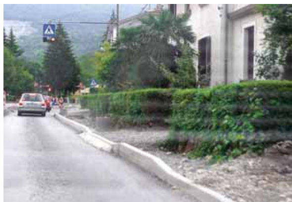
Še malo, pa bodo Deskle spet lepe.

Po projektu bo na celotni trasi vgrajena vodovodna cev premera 150 milimetrov za povezovanje celotnega naselja z vodo iz Močil