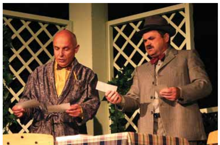
Ingoličevi Krapci v izvedbi AGD Kanal.

Letos si je šest predstav ogledalo okoli 1500 gledalcev, ki so navdušeno spremljali dogajanje na odru, tako da jih ni prestrašil niti dež na koncu predstave Hamlet v sosednji vasi. »Gledališče na Kontradi se vsako leto bolj razvija v srečanje različnih gledaliških skupin iz vse Slovenije in zamejstva kjer lahko izmenjamo svoje poglede na amatersko gledališko dejavnost, kar nam daje idej in zagona za naprej,« je zaključil Pušnar.