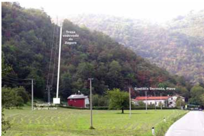
Tako naj bi potekal vodovod.

Cevovod premera 60 milimetrov iz modularne litine poteka v strmih delu na površini in bo zaščiten pred zmrzovanjem, v nadaljevanju pa v trasi ceste skozi celotno naselje. Hišni priključki z vodomeri bodo narejeni v dogovoru z odjemalci na javni površini. Za dela je v proračunu za leto 2006 rezerviranih 25 milijonov tolarjev. Celotna investicija pa je ocenjena na približno 55 milijonov tolarjev.