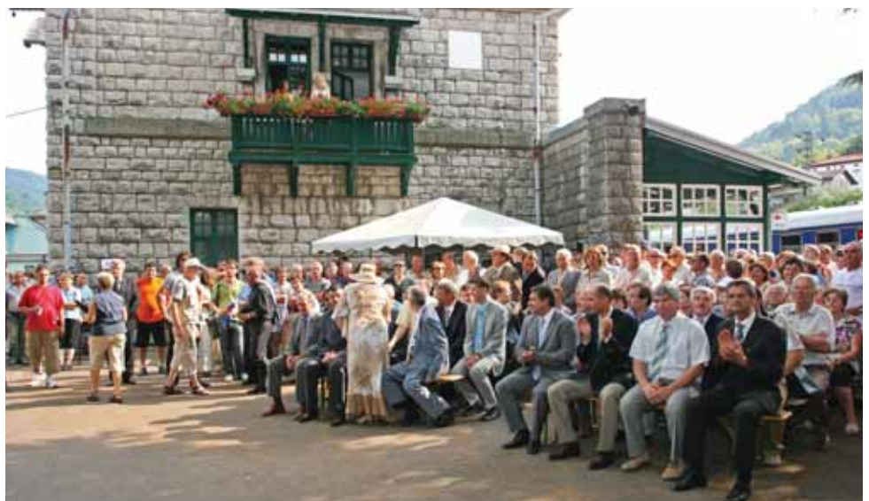
Na postaji v Kanalu so pripravili kratko prireditev.

Med naštetimi pomembnimi gosti kronist omenja še načelnika cestnega odpora, načelnika sodnije, davkarja, finančnega komisarja, podjetnike, šolsko mladino pod vodstvom nadučitelja, vojaško veteransko društvo, požarno stražo, društvo čitalnica z zastavo na čelu in mnogobrojno ljudstvo. Napiše tudi, da je Njegova cesarska in kraljeva visokost prijazno sprejemal pozdrave in z vsemi gori naštetimi govoril en par besed.