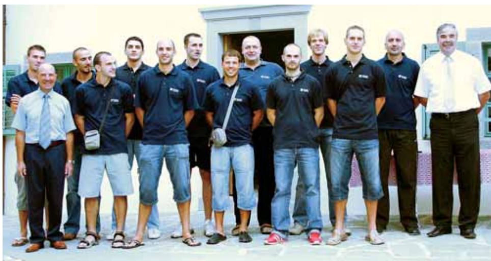
Ekipa OK Salonit Anhovo v sezoni 2006/2007.