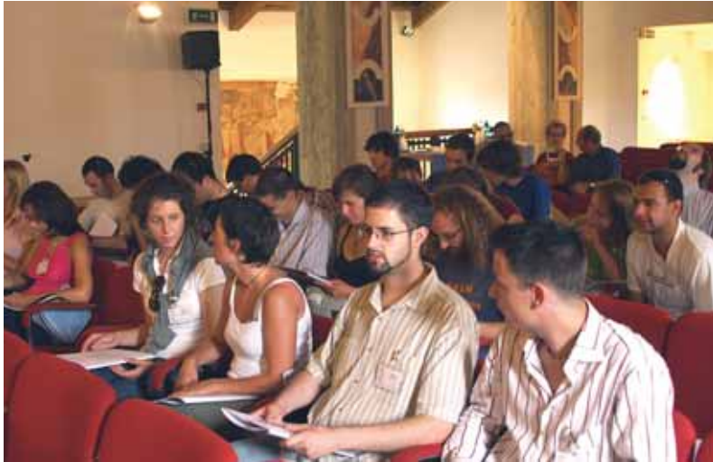
Mladi iz enajstih držav so razmišljali o bodočih zgodovinskih in naravnih parkih v Evropi.

V prejšnjih številkah glasila Most smo pisali o sodelovanju med občino Kanal ob Soči in italijanskim združenjem Čedajska listina (Carta di Cividale) na področju srečanja mladih, ki ga združenje organizira vsake dve leti.