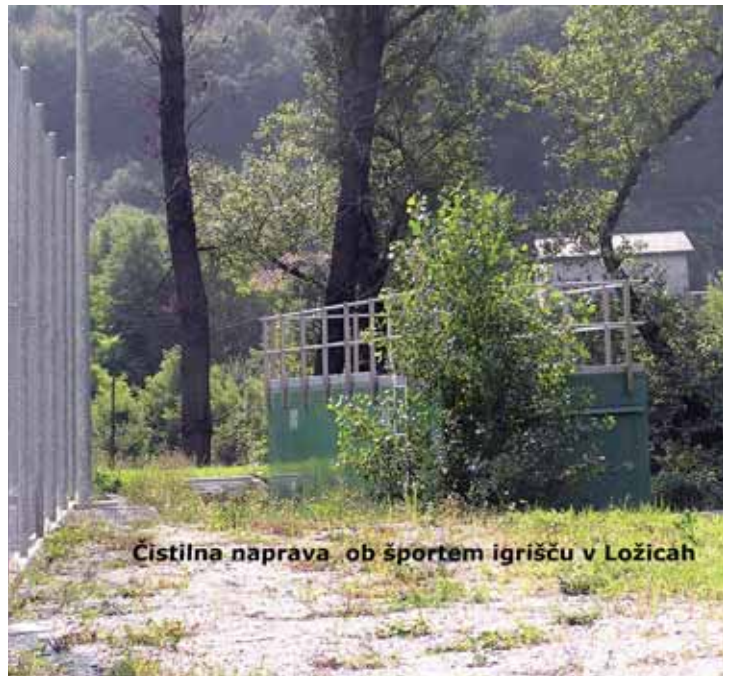
Čistilna naprava bo zopet delovala.

Preplastitev cestišča se začne nekoliko naprej od križišča za Zarščino na naši strani do občinske meje v dolžini dveh kilometrov in naprej na briški strani v dolžini enega kilometra. Popravljen bo nekaj prepustov za odvodnjavanje ceste in podpornih zidov, izvršena preplastitev v asfaltu debeline 6 centimetrov, urejene bankine postavitve varovalnih ograj in cestna signalizacija. Ko bomo brali te vrstice se bomo že pripravljali na otvoritev te pridobitve.