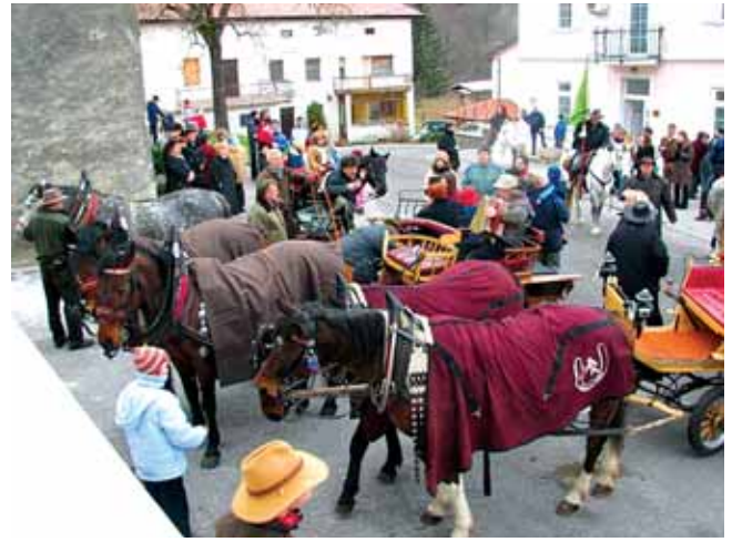
Konji v kraju vedno pritegnejo pozornost ljudi.

Pohvalimo se lahko s pestro aktivnostjo. Sami organiziramo prireditve in številna enodnevna in dvodnevna jezdenja z organiziranimi prenočitvami ljudi in konj po kanalski občini, pa tudi izven nje. Sodelujemo na številnih prireditvah drugih društev in podobnih organizacij. Načrtujemo tudi sodelovanje z organizacijami, ki uporabljajo fizioterapevtske programe - določene zdravstvene terapije s konji. Trudimo se tudi, da bi organizirali lastno podkovanje (kovaštvo konj). Urejamo in označujemo jahalne poti. Vsako leto organiziramo »žeganje« konj, kot tudi enodnevni izlet v Verono, kjer se predstavljajo konji in vsa oprema, ki je vezana na ta šport.