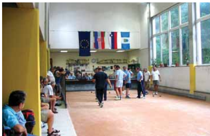
Prizor s tekmovanja.

lige iz Jesenic in Planine pri Ajdovščini ter zelo kakovostnega moštva iz Labina (Hrvaška). Poleg teh je na turnirju sodelovala tudi ekipa SGP Nova Gorica, ki trenutno nastopa v II. slovenski ligi. Ta je na koncu slavila z osvojenim prvim mestom pred Jesenicami in domačo ekipo iz Kanala.