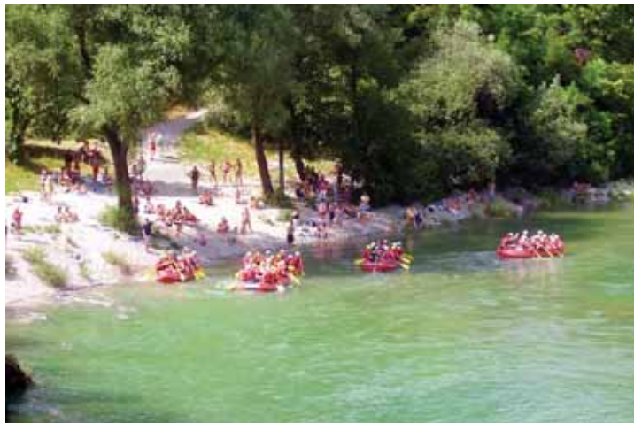
Letos se je po Soči spustilo pet raftov.

Da bi porabili nabrane kalorije, so se spustili po Soči vse do Plavi. Tam se je druženje nadaljevalo s tekmovanjem v raznih igrah in zabavo. Predstavniki vseh raftov so prejeli priznanja, prvi trije pa tudi pokale. Na prvem mestu je bila ekipa Esala, na drugem TD Kanal ob Soči, na tretjem pa ekipa Salonita.