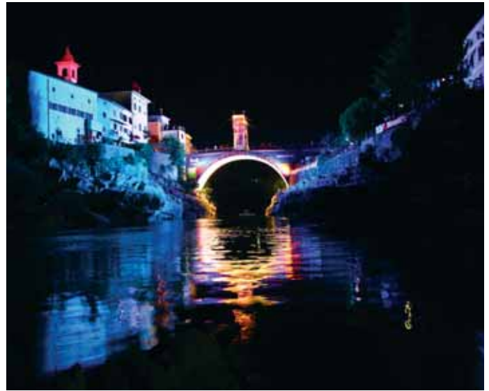
Kanalski most v prečudovitih barvah barvnega šova.