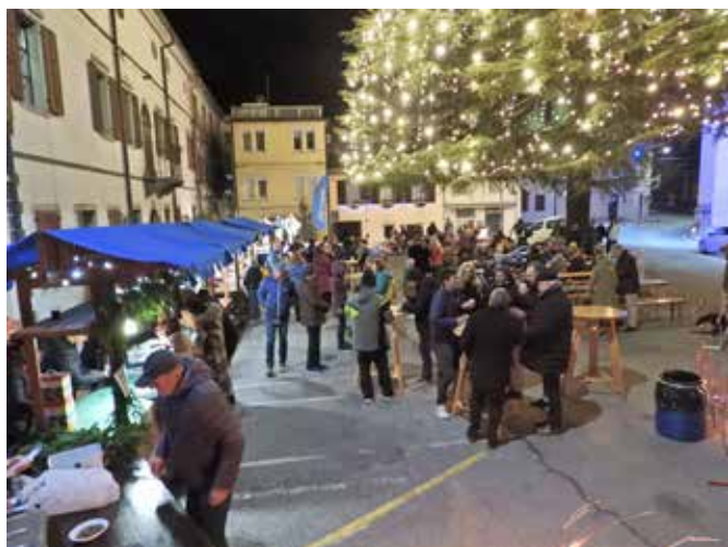
Obiskovalci so se pogreli z golažem, ki so ga pripravili lovci LD Kanal.

Tudi tokrat gre zahvala Turističnemu društvu Kanal in številnim nastopajočim iz društev v občini. Ker je za tako obsežno prireditev iz občinske blagajne namenjenih le nekaj sto evrov, gre še posebna zahvala in priznanje vsem, ki žrtvujejo svoj prosti čas za to, da je v Kanalu tudi prednovoletni čas prazničen.