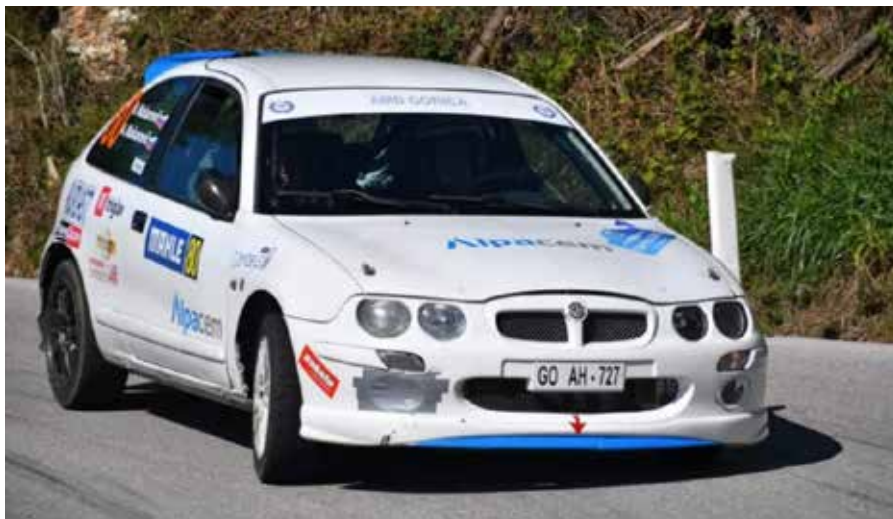
Rally Nova Gorica (bel MG ZR 105)

Avtomobilizem je šport adrenalina in hitrosti. V Sloveniji ima več kot stoletno tradicijo. Severna Primorska je bila ena izmed ključnih regij pri njegovi uveljavitvi. Reli je avtomobilistično tekmovanje z določeno povprečno hitrostjo, ki deloma ali v celoti poteka po cestah, odprtih za promet. Trasa vsebuje eno ali več hitrostnih preizkušenj (HP) na zaprtih cestah. Nastopajo posadke z licenco, ki jih sestavljata voznik in sovoznik. To pomeni, da je reli sestavljen iz etap po odprtih cestah v rednem prometu, na katerih morajo posadke upoštevati cestnoprometne predpise in v točno do-