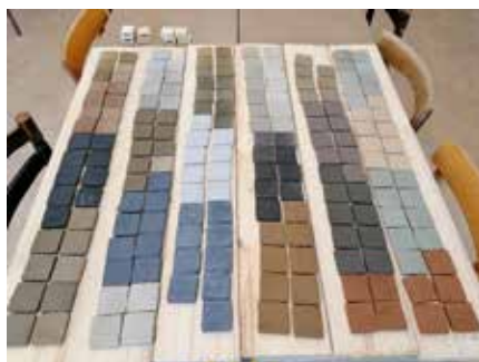
Barvite testne ploščice pred žganjem

Člani delovne skupine se pri svojem delu obračamo k dediščini, k temu, kakšna sta bila raba gline in izdelava keramike nekoč, in k lokalnemu okolju. Ob široki ponudbi izdelkov na trgu, ki izvirajo z vseh koncev sveta, nas je gnala želja po tem, da spoznamo, kje lahko v našem okolju najdemo gline, kakšne so njihove