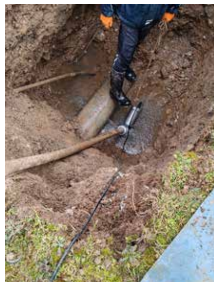
Lom cevi na globini dveh metrov

Vsa načrtovana vzdrževalna dela, ki lahko povzročijo motnje ali zahtevajo pre-