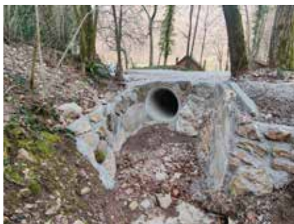
Prepust v Grajski ulici