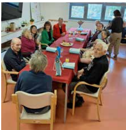
V Domu upokojencev Gradišče smo se podružili ob sladkarijah. Tu živi kar 13 naših občanov. Vsak s svojo posebno zgodbo. Življenje jim je postavilo mnoge ovire, pa tudi trenutke, ki kljub težkemu življenju zarišejo nasmeh na obraz.

Navdušeni so bili, da bodo lahko podelili nekaj slikic s sosedi, sovaščani, znanci.