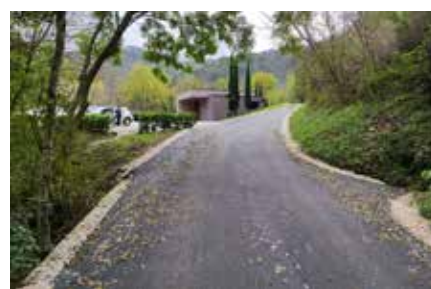
Asfaltirana pot v Prilesje

Z izvedbo teh del se je bistveno izboljšala kakovost infrastrukture, kar prispeva k boljši uporabniški izkušnji in večji varnosti. Kljub izzivom, ki jih prinašajo nenehne potrebe po sanacijah in vzdrževanju, smo dokazali, da lahko s strokovnostjo, predanostjo in dobrim načrtovanjem uspešno rešujemo tudi najzahtevnejše situacije.