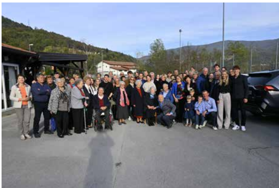
Skupinska fotografija s praznovanja stoletnice