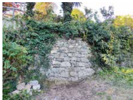
Obnovljen zid v Plavah