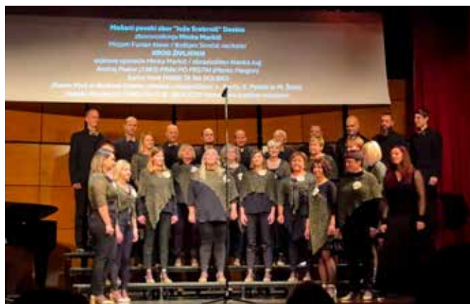
Nastop na Sozvočenjih 2024