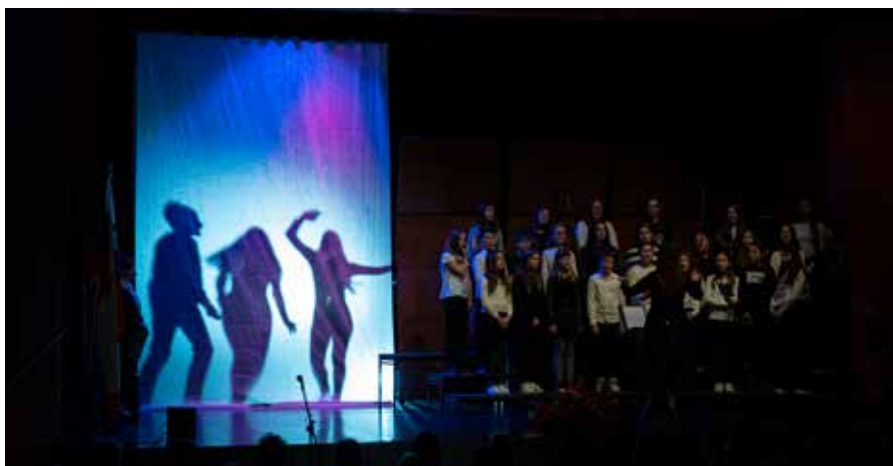
Program proslave so oblikovali otroci iz vrtca Deskle in učenci OŠ Deskle.