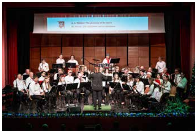
Praznično soboto smo preživeli z glasbo.