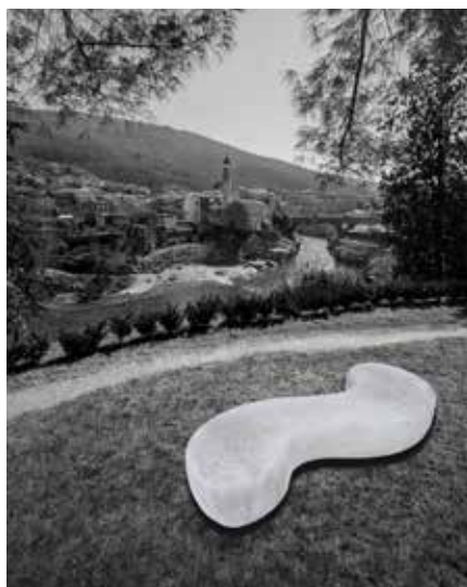
Impulz za Sočo

izbrisno vtisnil v moje kosti in kri. To je tista bistra hči planin, ki je kot tek deklet s planine, še preden zastane v jezeru ob Mostu na Soči. Reke so kot žile, ki deželam prinašajo življenje. Jezovi so kot krvni strdki, ki rekam onemogočajo njihov namen. Soča pod jezovi ni več ista, njen pretok je zmanjšan, saj za potrebe hidroelektrarn teče v podzemnih ceveh. Rečni tok je oskrunjen in s tem je dolina prikrajšana za polno življenjsko moč. Že 23 let postavljam kamnite skulpture, ki so zame kot živa bitja - ORGANIZMI. V sklopu