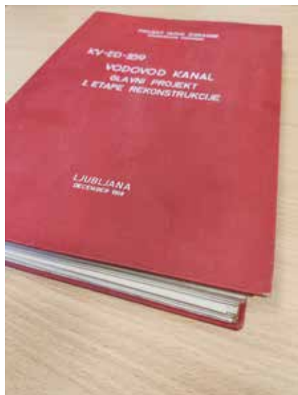
Projektna dokumentacija iz leta 1968

Občina Kanal ob Soči je za obnovo zagotovila sredstva v proračunu, projektiranje in tudi končno izvedbo pa je prevzel lokalni izvajalec KSI-TECH, d. o. o. Dela so potekala decembra in trajala tri tedne. V tem obdobju je bila vzpostavljena obvodna povezava, voda se je v Kanal dobavljala neposredno iz vodarne Avče. To so bili za izvajalca izredno napeti trije tedni, saj bi v primeru večje motnje v omrežju ali pojava puščanja prišlo do