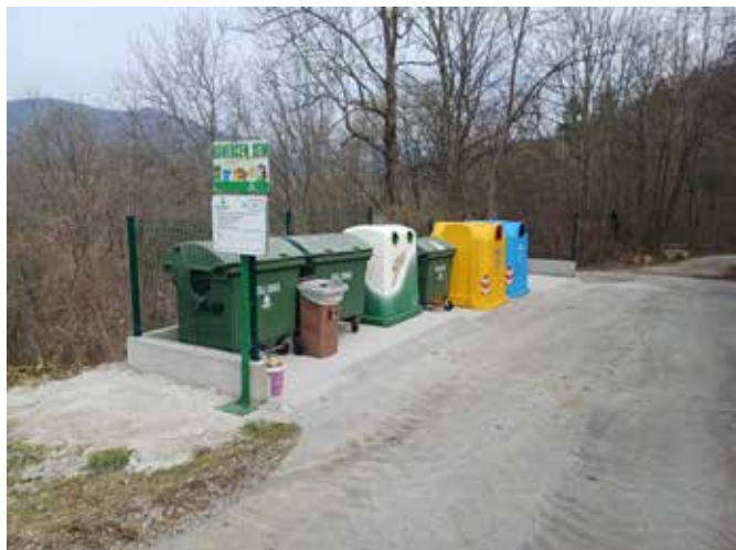
Obnovljen ekološki otok na Kambreškem

odločila za izvedbo zaprte ploščadi, ki občanom omogoča primerno odlaganje odpadkov z vrtov in okolice, komunalni pa omogoča preprosto odstranjevanje zbranih odpadkov. Pogodbena vrednost ureditve ekološkega otoka znaša 16.500 evrov.