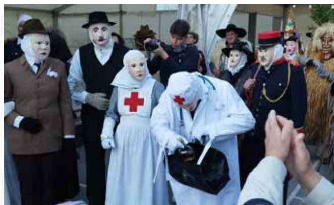
Pust na drsališču