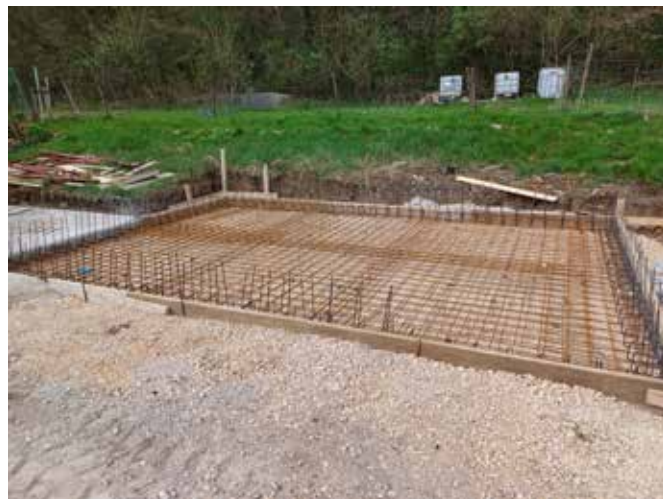
Ploščad za odlaganje zelenega odreza pred betoniranjem