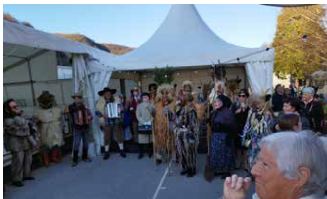
Pust na drsališču