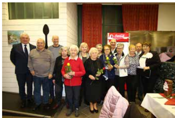
Naši jubilanti so z veseljem pozirali fotografu. Se vam zdi, da je med njimi kdo, ki je obeležil že 100-letnico?