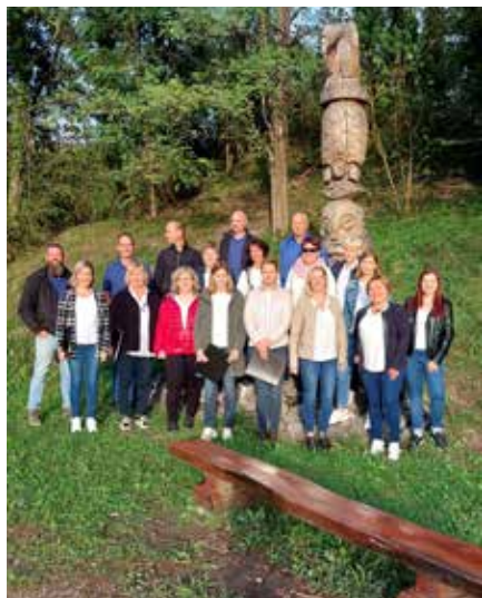
Uvodni nastop sezone v Desklah

Naše življenje je pesem, ki jo prepevamo dan za dnem. Nikoli se ne konča, saj vsak njen začetek v sebi nosi skrivnostni utrip nekega novega verza. Prvi takt je kot rojstvo. Takrat se v mehki mesečini rodi prva ljubezen in lahko slišimo nežne, tihe, komaj zaznavne note in melodije, ki še iščejo svoj pravi smisel, ne vedoč, kam jih bo zapeljala neusmiljena usoda življenja. Pesem življenja se nato krepi, raste, sega višje in dlje, postaja hitrejša in močnejša. Nežna melodija nenadoma preide v ritem, ki ga vodi radostno bitje srca. Poroka je tisti trenutek, ko dva glasova postane-