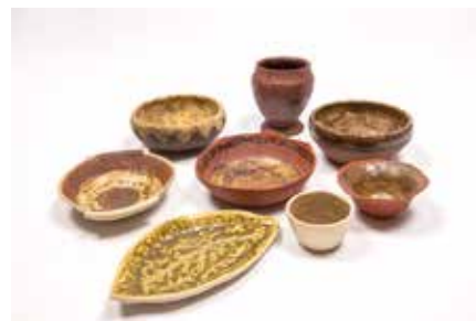
Testni izdelki iz lokalnih glin

Povezava z muzejem kot akumulatorjem naših tisočletnih znanj je bila pri tem projektu zelo pomembna, predvsem zaradi dostopa in izmenjave informacij ter dopolnjevanja znanj. Na drugi strani so nam pri začetnem delu, iskanju lokacij glin, izredno pomagali domačini, ki svoje okolje najboljše poznajo. Gline so namreč odložene v bolj obsežnih slo-