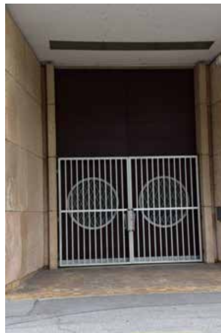
Detaji HE Plave