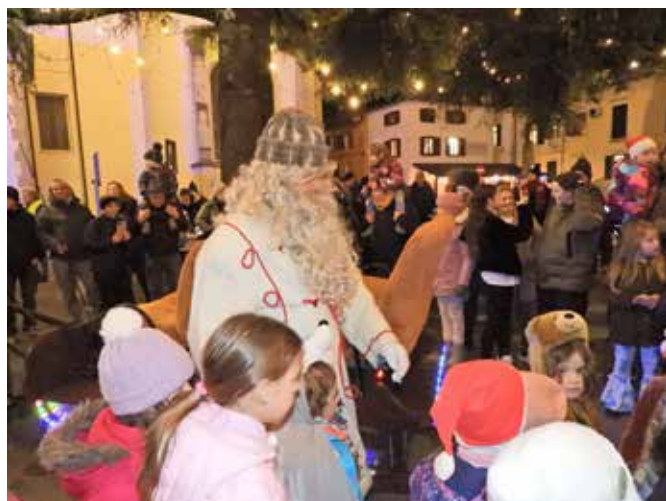
Prihod Dedka Mraza je navdušil predvsem najmlajše.