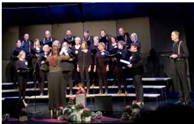
Gostje na koncertu v Tolminu

Dva dni kasneje je zbor v nedeljo prvič nastopil še na Cecilijanki 2024 - 65. reviji goriških pevskih zborov v Kulturnem centru Lojze Bratuž v Gorici. Tu so imeli pevci novo priložnost, da se predstavijo širšemu občinstvu in izmenjajo glasbene izkušnje z drugimi sodelujočimi zbori. Pevski zbor Jože Srebrnič iz Deskel je več kot le skupina pevcev – je srce in glas kraja, ki s svojo glasbo povezuje različne generacije in prinaša svežino med ljudi, predvsem pa deli in širi dobro voljo.