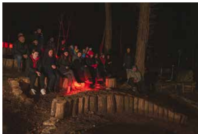
Lahko pa se samo usedeš in pobožáš les ter uživaš v njegovi toplini.