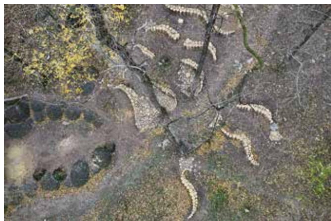
Valovila v čarobnem gozdu

Land art se z udomačeno tujko imenuje umetnost, ki je ustvarjena neposredno v pokrajini z uporabo naravnih materialov. V primeru Valovile, nastale na pobudo skrbnikov Parka Pečno, je to 40 metrov razžaganih akacijevih hlodov, zloženih v valovite palisade, ograje, po-