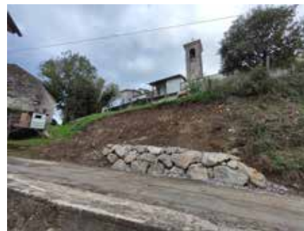
Sanacija podora v Gorenjem Polju