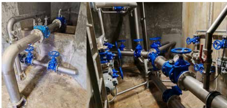
Stanje armatur in cevnih zvez po prenovi

prekinitve oskrbe – vodarna namreč ne zmore zagotavljati neprekinjene dobave vode v izrednih količinah. K sreči večjih zapletov ni bilo, razen nekaj nevšečnosti z nihanjem tlaka, kar so občutili predvsem uporabniki nižje ležečih objektov.