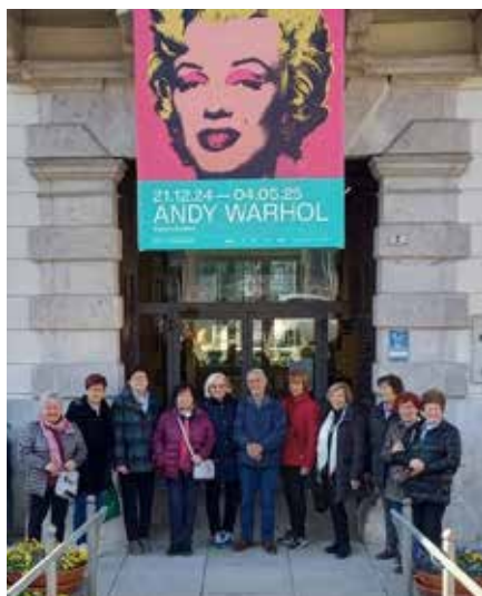
Slikarje Svetlobe je februarja očarala razstava v palači Attems Parzenstein Gorizia, ki v starih prostorih prikazuje 180 umetnin Andyja Warhola z naslovom Beyond Borders (Onkraj meja).

Z navdušenjem so obiskali palačo Attems Patzenstein Gorica, ki v skoraj 300 let starih prostorih v rokokojskem slogu na ogromnih površinah prikazuje 180 umetnin Andyja Warhola z naslovom Beyond Borders (Onkraj meja). Vstopili so v neslutni svet razsežnosti domišljije z umetnostjo. Projekt osvetljuje pot enega največjih protagonistov pop arta in javnost popelje v osrčje kulturne in umetniške revolucije, ki jo je lahko utelil Warhol.