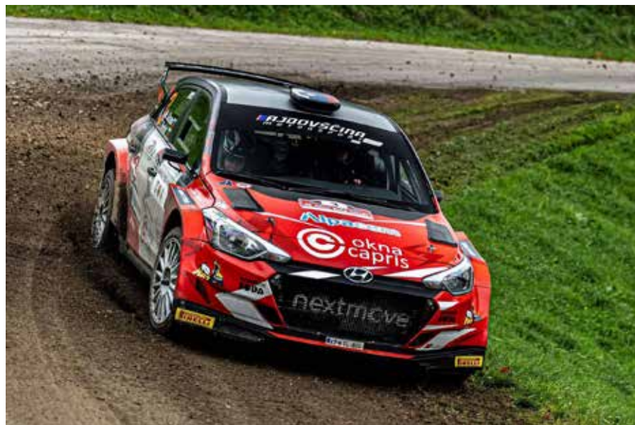
Rally Soča valley (Hyundai i20 R5)

ločeni minuti vstopiti v časovne kontrole. Povprečne hitrosti pri cestnem reliju so veliko večje kot pri makadamskem, je pa makadamski reli veliko atraktivnejše, ker je več drsenja dirkalnika in izgubljanja stika s podlago. Široka priljubljenost avtomobilskega športa je v svoje vrste pritegnila kar nekaj mladih iz naše občine.