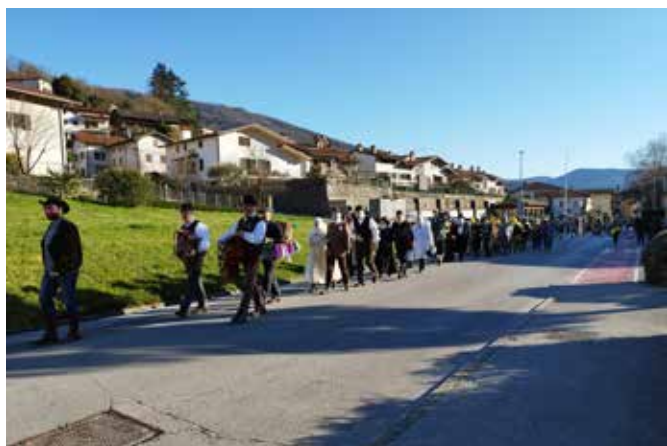
Pustna povorka po Kanalu