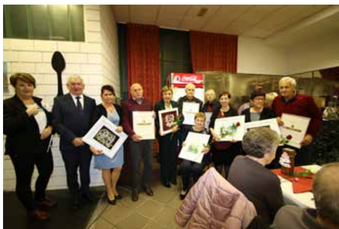
Jubilanti, zlatoporočenci in bisernoporočenci

odigra svojo vlogo. Hvala. Na srečanju nas je obiskal tudi Miklavž, ki je imel za vsakega nekaj, tudi za predsednika z darilcem in šibo, ki je za spomin ali opomin, kdo bi vedel. Srečanje smo zaključili ob rezanju pršuta, druženju in ob plesu. Hvala vsem, ki ste bili del te prelepe zgodbe.