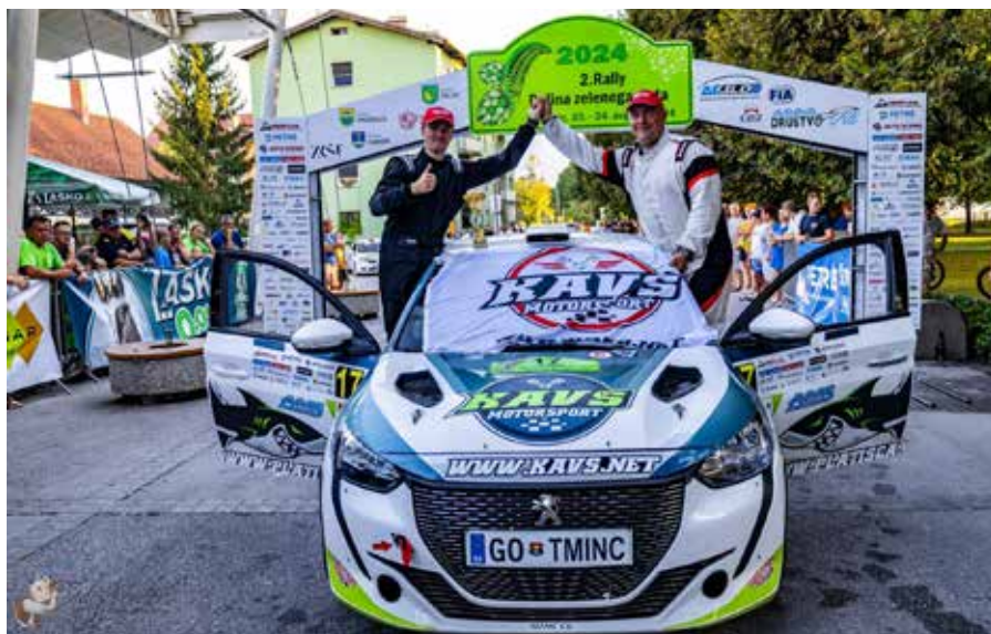
podelitev Rally Dolina zelenega zlata (Peugeot 208)