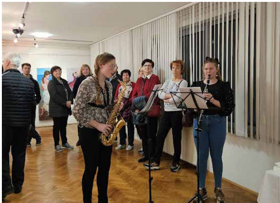
Odprtje razstave