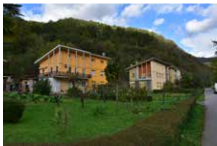
Delavsko naselje Plave