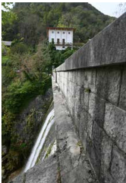
Hiša upravnika, Podselo