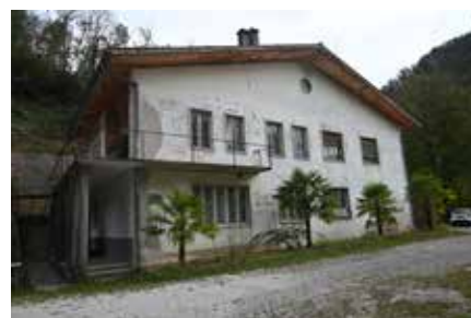
Stanovanjska stavba, Podselo