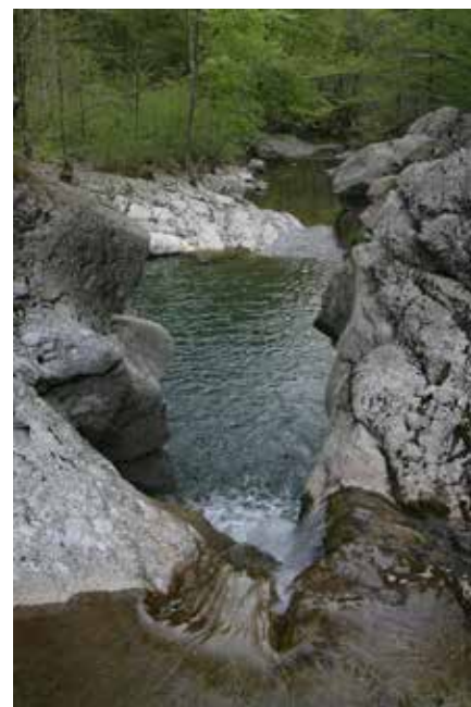
Obmejna reka Idrija

vsakovrstni kugi iz enega brega stopiti na drugi. Morda bodo še ta potok, posebno ob vročem poletju, Italijani porabili za varstvo proti kugi ter njeno moč prodajali po svetu za razkuževanje. Po tem takem bode kugi za vselej na tem svetu odklenkalo.« Kaznovana kmeta sta glede globe prosila za pomoč goriško deželno glavarstvo, posebno peticijo glede postopanja italijanske finančne straže pa so na dunajsko vlado naslovile številne obmejne občine. Iz časopisja ni razvidno, ali je bila pritožba uspešna, a nam dogodek poda zanimiv pogled na dogajanje ob meji.