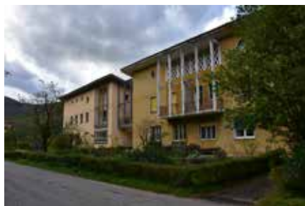
Delavsko naselje Plave