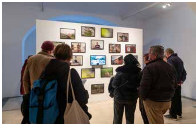
Odpri razstave »Dolina«, Galerija Vžigalica, Ljubljana, 4. 2. 2025

Ravno pred kratkim sem svoje kolege iz ZRC SAZU vodila po razstavi, ki jih je očitno nagovorila. Na koncu so sicer izjavili, da bi si pri njeni kompleksnosti želeli več jasnih odgovorov. Moja replika na to je bila, da umetnost ni tu zato, da ponuja enoznačne odgovore, temveč predvsem zato, da v nas odpira vprašanja.