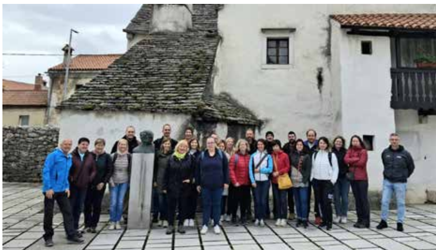
Pevci na Krasu

ta en sam, kot se v pesmi združijo roke in uskladijo koraki in ritem hrepenečega srca postane prelepa simfonija dveh. Ljubezen postane moč, ki kot reka teče skozi čas, preplavlja vsak trenutek in vsako misel. Sreča se širi vsepovsod in nosi spomin na korake, ki so se združili v eno skupno pot. A pesem se v nekem trenutku nenadoma konča, preide v tišino, zamre in obmolkne, ostaneta le njen odmev in lep spomin nanjo. Podobno pride konec tudi v življenju. A nikdar zares. Smrt ne prinaša vedno teže slovesa. Kar se zdi kot slovo, je le prehod v tišino. Včasih je to le zadnji verz pesmi, ki ga prav po tiho, po prstih odnesejo v večnost. Zven počasi utihne, a ostaja med nami, v zraku, v srcu. In ko se ena pesem konča, se začne nova. Življenje teče naprej kot neskončna melodija, ki nežno, skoraj neopazno kroži med nami in povezuje rojstva in slovese – iz prvega nežnega diha v tiho slovo, vse je del ene same pesmi, ki jo svet prepeva, znova in znova.