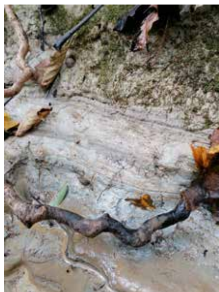
Glina v strugi potoka Avšček

ve lastnosti in ali so primerne, da bi jih uporabili pri rokodelskem oz. umetniškem oblikovanju.